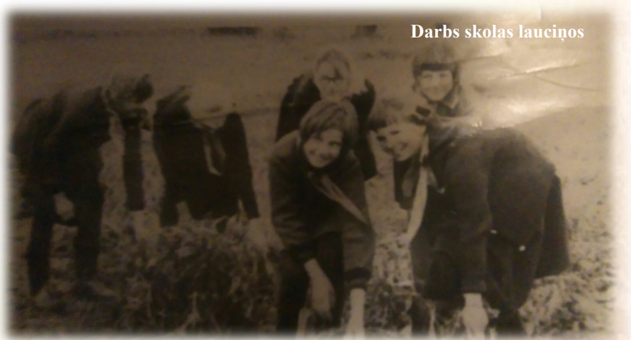
Darbs skolas lauciņos