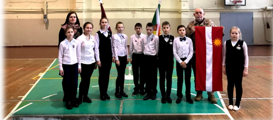
Ierindas skatē Madonā, 5./6.kl. komandai 2.vieta