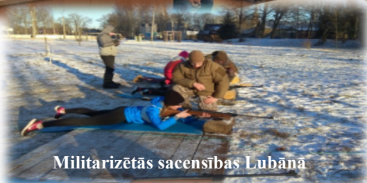
Militarizētās sacensības Lubāna