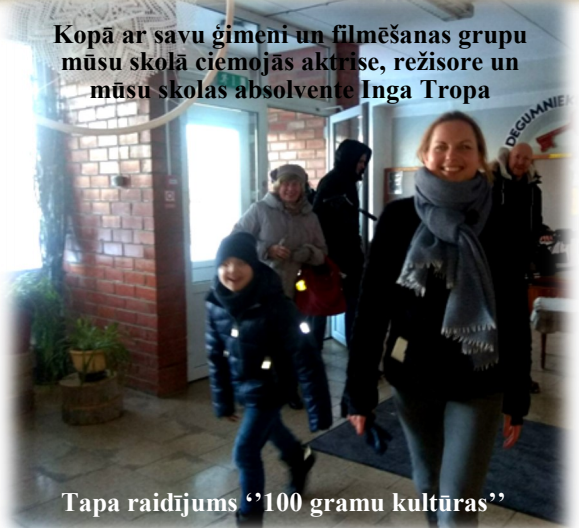
Tapa raidījums "100 gramu kultūras"