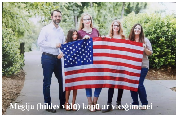
Megija (bildes vidū) kopā ar viesģimeni

JĀNIS: Iedomāties varu, bet nezinu vai ko vairāk par to . Tā ir tikai vēlme, nodarbotos ar mārketingu jo tā tur tagad trūkst .